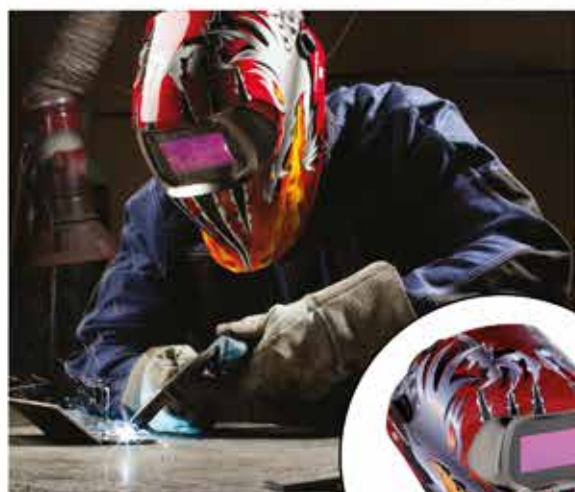
ESTILO FURIA DE DRAGÓN